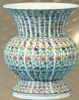
A3059 鬥彩花卉紋菊瓣尊