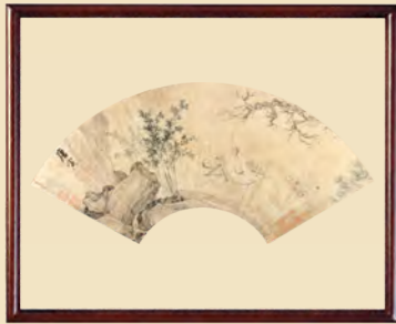
明·唐寅·松陰高士圖